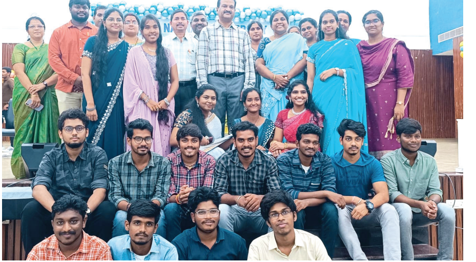
ఇంజనీరింగ్ విద్యార్థులు ఆటలు, పాటలు, వివిధ సాంస్కృతిక కార్యక్రమాలతో సందడి చేసారు. ఈ కార్యక్రమంలో ప్రిన్సిపాల్ అధ్యాపకులు పాల్గొన్నారు.