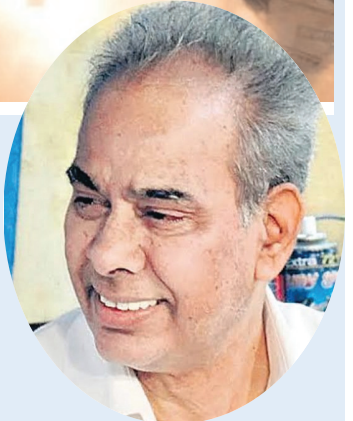
భారతీయ శాస్త్రవేత్తల పరిశోధన కౌశలానికి వారి అఖండ విజయానికి సమర్పిస్తున్న నూలుపోగు.